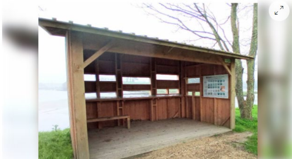
L'observatoire ornithologique de Tréglonou sera inauguré place de Penn-ar-Pont, mardi 16 avril, à 11 h. | OUEST-FRANCE

Chaque matin, recevez toute l'information de Brest et de ses environs avec Ouest-France