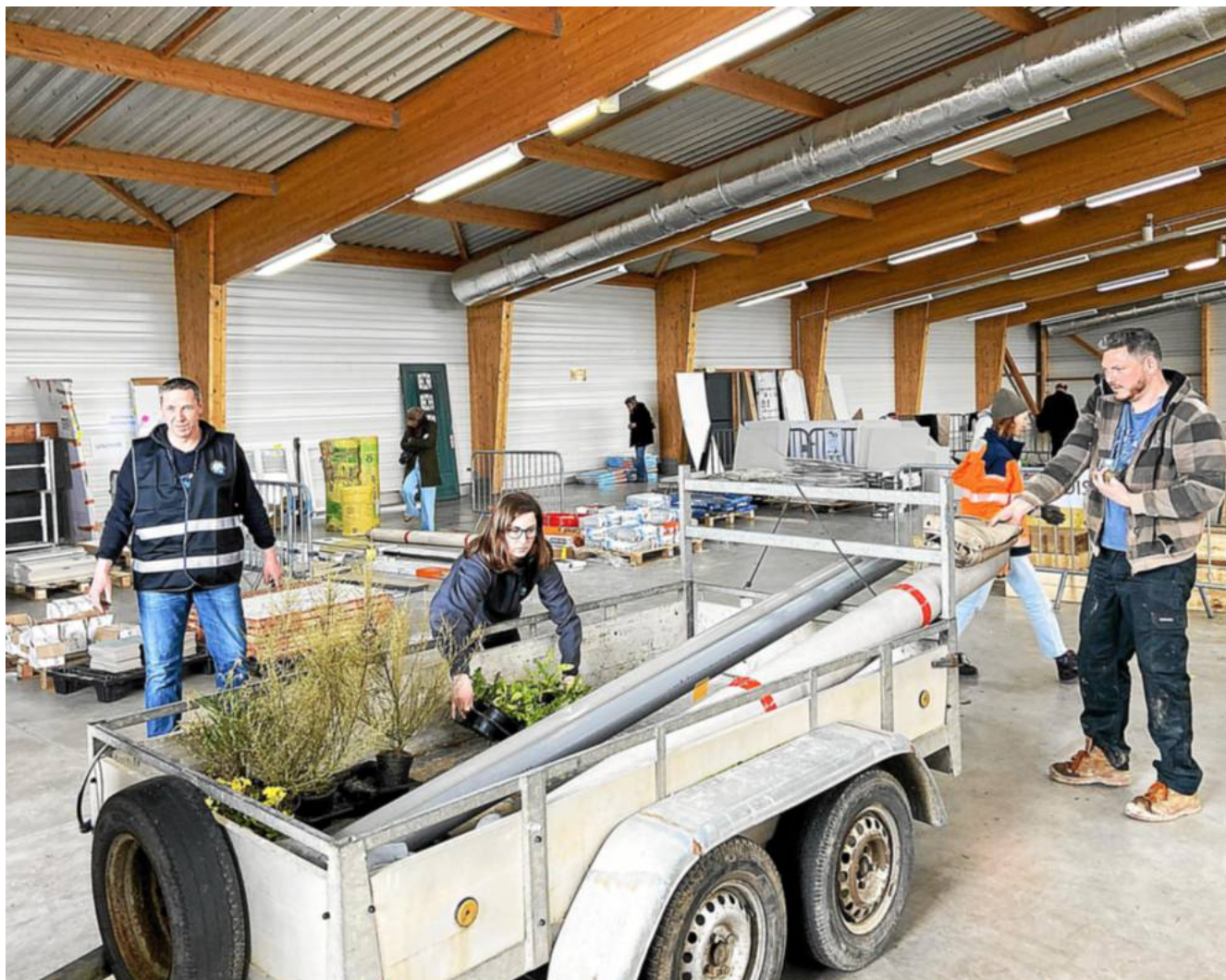
En mars 2023, la troisième édition de la Brocante verte et des matériaux avait eu lieu à la halle multifonctions de Ploudalmézeau. Les particuliers avaient été nombreux à profiter de matériaux et de végétaux vendus à bas prix.