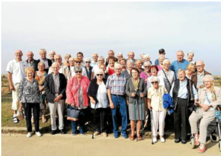
Les adhérents de l'Association des anciens combattants et veuves de la commune ont tenu leur assemblée générale mercredi.

souvenir, du respect et de la solidarité.